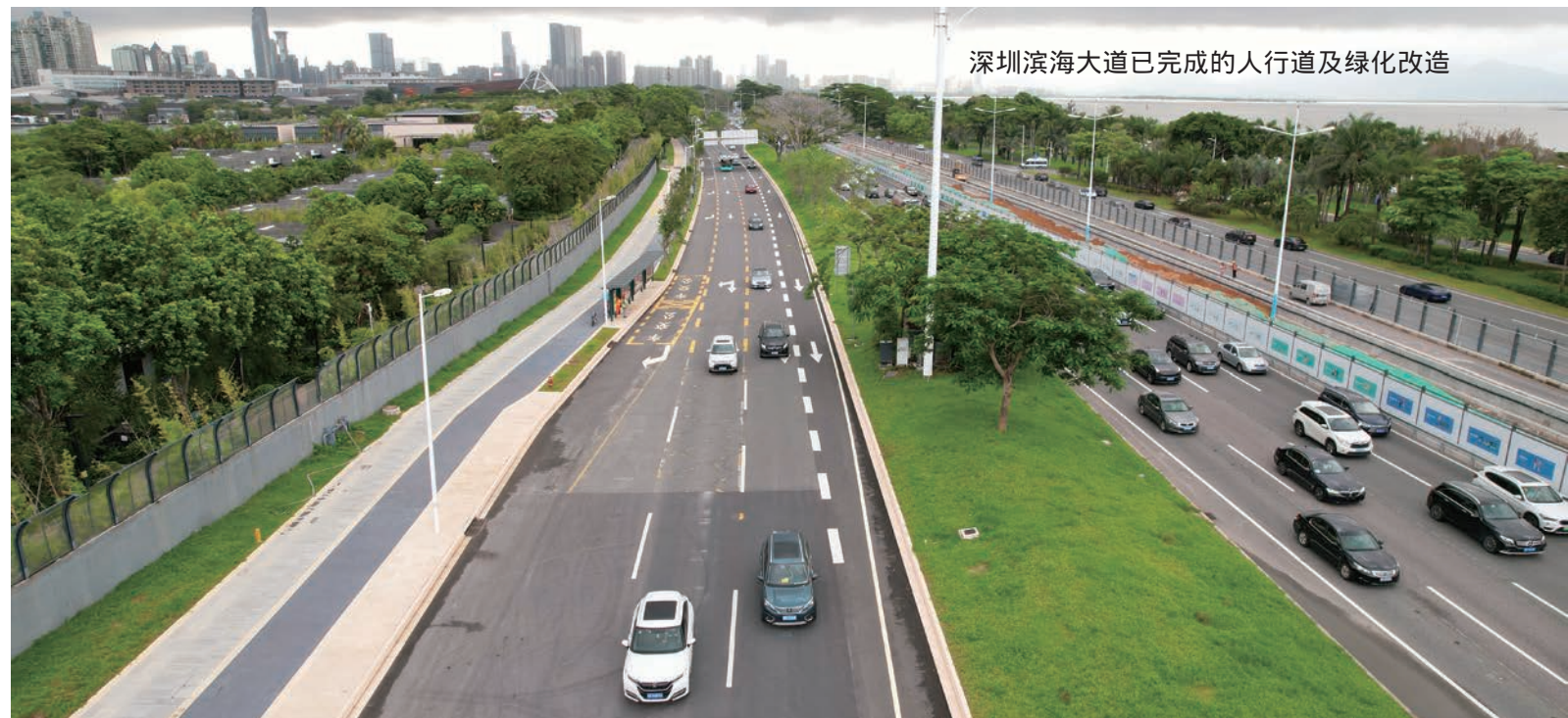
深圳滨海大道已完成的人行道及绿化改造

二是践行绿色环保，提升企业社会形象。深圳滨海大道项目部党支部组织全体干部职工认真学习习近平总书记关于生态文明建设一系列的重要论述，落实各项环保措施在项目上的应用，以形成有效竞争力，促进企业社会形象。成立了以项目主要负责人为组长的环保建设及提升管理能力项目推进小组，负责各项工作方案制